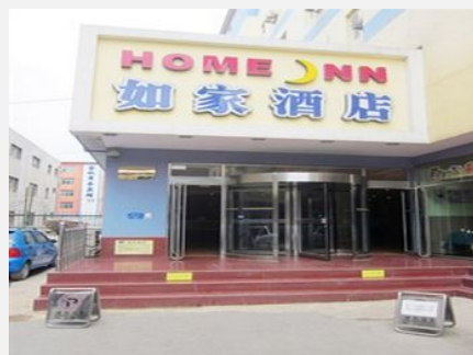
如家快捷酒店（盘锦双台子商业城店）

简介：如家快捷酒店（盘锦双台子商业城店）位于辽宁省盘锦市最繁华的商业区渤海路，紧邻辽河商业城、国美电器盘山店；邻近双台子区法院、双台子区政府、兴隆大厦二百、湖滨公园等地，环境优美，出行便捷。