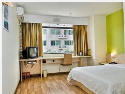
7天连锁酒店（盘锦火车站店-原湖滨公园店）

简介：盘锦湖滨公园店坐落于盘锦市双台子区，毗邻我国平原面积最大的公园——湖滨公园。园内曲径交错，绿树苍翠，草坪成茵，鲜花争艳，一湾碧水，波光潋滟，青葱芦苇，随风摇曳，呈现出生机盎然的幽美境界。