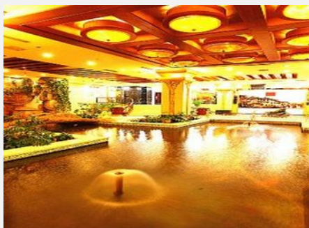
盘锦大众花园宾馆

简介：宾馆拥有各种类型豪华客房 154 间，房间宽敞明亮，设施齐全，舒适洁净，装潢一流，格调高雅，是居家旅行、外埠商旅停泊的理想港湾。