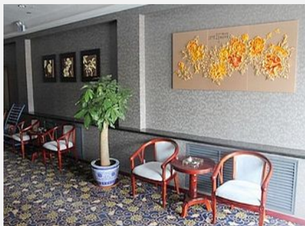
盘锦怡康商务酒店

简介：酒店现有 70 间不同房型供宾客选择，客房装修独特典雅、舒适怡人，客房内配有会客厅、电脑、卫星电话、卫星电视、宽带、空调、淋浴、保险箱、消防安全系统等先进设施，并支持信用卡结算，是您休闲度假的理想选择。