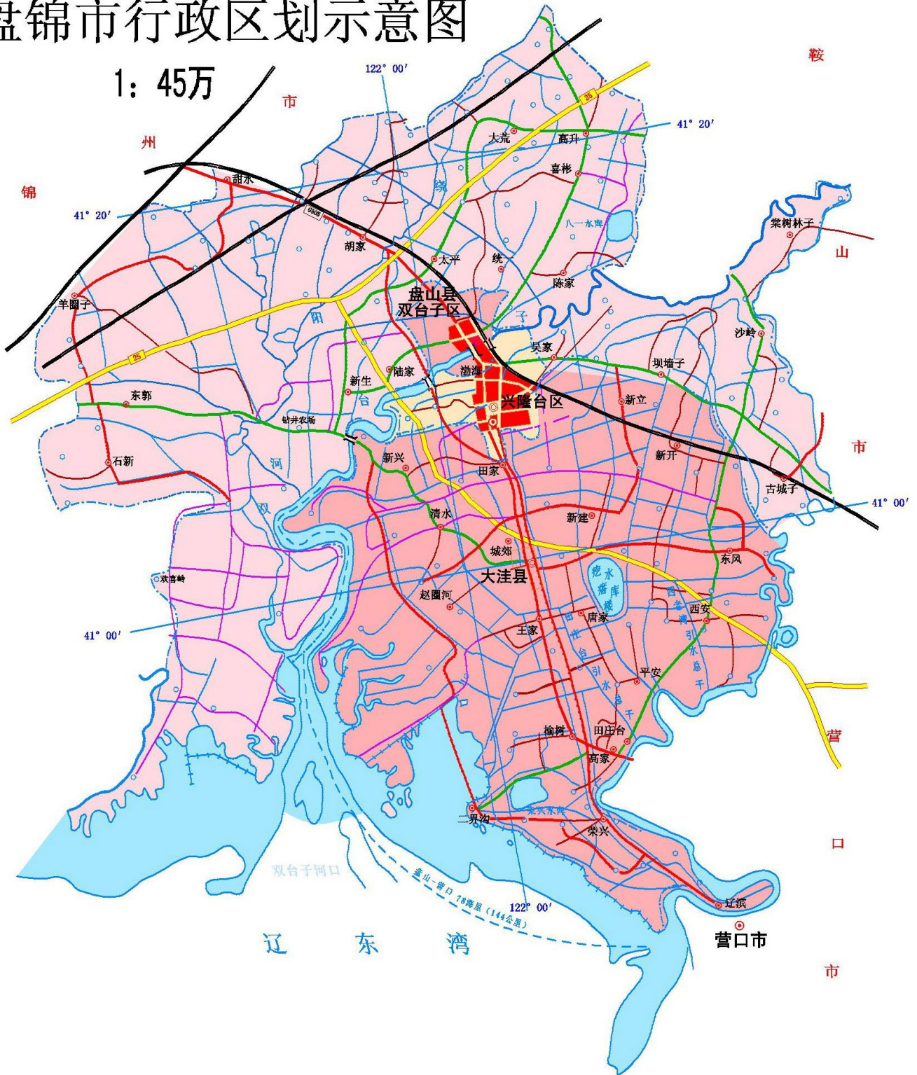
盘锦市行政区划示意图