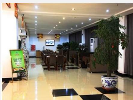
辽滨东方百捷酒店（盘锦）

简介：交通十分便捷。东方百捷是一家舒适、高效、快捷的自主品牌经济型酒店。酒店拥有各类客房、棋牌室、以及设施完备的中小型会议室，并提供营养健康的自助早餐和经济营养的零点午、晚餐。东方百捷将以便捷舒适、时尚现代、高性价比的特点，塑造盘锦有限服务酒店的典范。