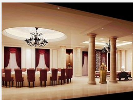
盘锦辽滨柏栎饭店

简介：饭店竭诚为中外宾客提供全方位的舒适体验。舒适、雅致的客房，齐全的休闲娱乐和会议设施以及贴心的服务，无不向宾客诠释着法国“柏乐”品牌所推崇的生活主张——自然、亲近和乐活。