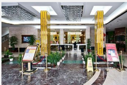
速8酒店（霞浦国谊店）

简介：位于霞浦商务中心区域，地理位置优越，交通便利，环境优美。酒店拥有格调高雅清新时尚的客房，装修考究、时尚别致、极具个性化，感觉温馨舒适。每间客房配备有液晶电视，迷你吧台、免费国内长途、24小时热水循环系统等，豪华房、套房配有电脑15兆高速光纤宽带免费上网。