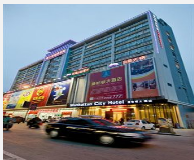
宁德霞浦曼哈顿大酒店

在霞浦的部分乡镇，也有一些小旅馆和酒店，而且都集中在镇上，虽然方便度和住宿条件不及县城，但是离拍摄景点相对较近。三沙、沙江、盐田几个镇距离县城比较近，基本上是回县城住，而溪南与长春比较远，可住镇上。