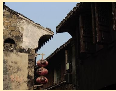
西溪、西塘二日游 免费上门接