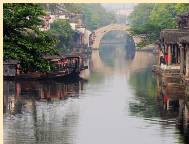
杭州南浔西塘二日游