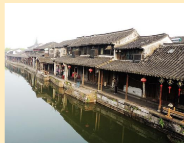
杭州一日游+西塘古镇一日游