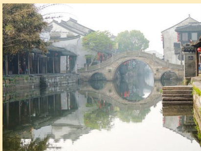
杭州出发西塘苏州两日游