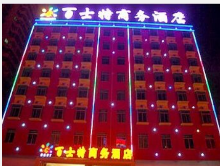
海口百士特商务酒店

简介：海口百士特商务酒店是全新酒店经营模式，让客人真正体验什么是人性化的设施，人性化的服务。酒店设施周全，房间内设有空调、暖气、洗衣机、超大屏幕电视、免费的宽带上网、楼道口还设有烘干机。酒店优越的地理位置孕育了无限的商机，位于城市、金融、商务中心地段，极大方便您的商务活动和旅游需求。