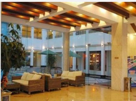
海南阳光世纪国际公寓 (海口)

简介: 海南阳光世纪国际公寓 (海口) 位于海甸五西路 (世纪大桥旁), 是一家商务旅游度假公寓。与市中心只是一桥之隔, 邻近海南大学、白沙门生态公园、世纪大桥、市人民医院、万绿园, 公交线路四通八达, 即可享受宁静环境, 亦可享受购物的方便。