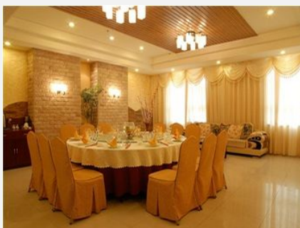
海南金宝莱商务酒店 (海口)

简介: 金宝莱商务酒店位于海口城西路, 是海口龙昆、金盘和凤翔交汇的金三角。各种客房 100 间, 均配有电脑。酒店有市内最顶级的多功能会议厅。金宝莱银江春大酒楼经营琼粤经典菜、粤式早茶, 有豪华包厢, 接待结婚及各种宴席。酒店有 5000M 大型后花园。有篮球、乒乓球、健身娱乐园、保健等多项康乐设施。有绿荫停车位 100 多个, 市政大道四通八达, 往返机场公需 20 分钟!