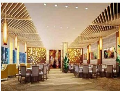
海口嘉凯皇冠酒店

简介：海口嘉凯皇冠酒店由海南凯都实业有限公司投资兴建。是一家集客房、餐饮、娱乐为一体的主题商务休闲酒店。火车站、城际轻轨站、汽车站近在咫尺，至轻轨站开车只需 1 分钟、汽车站 6 分钟、机场 20 分钟，交通便捷。