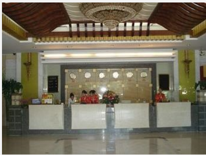
海口茅台迎宾酒店

简介：海口茅台迎宾酒店是贵州茅台投资的商务休闲型酒店，位于凤翔路 26 号，步行可至海南省高级人民洗院，附近主要高校有：海南师范大学，海南农业学校，华南热带大学，海南医学院，海南高级技工学校，环境舒适。