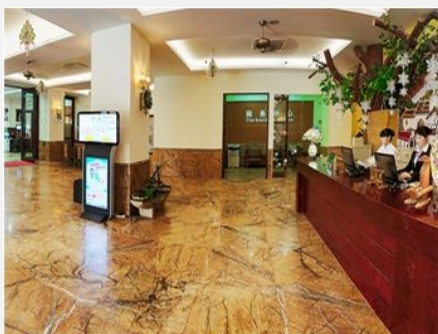
海口新标榜休闲度假酒店（海口新标榜度假休闲港）

简介：新标榜属海南首家引领时尚、健康、集商务客房、餐饮、商务会议、美容美发、中医、足疗、水疗等服务项目为一体的四星级休闲度假型酒店。离海口美兰机场 30 分钟，离车站、码头仅 10 分钟车程，是社会各界人士居住、休闲度假的理想之地。