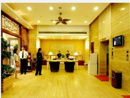
海口绅蓝都市公寓

简介：海口绅蓝都市公寓是全国首家共管式商务公寓。公寓推崇时尚环保的生活方式。大堂布局简约典雅，用细节营造出浓郁的欧亚热带风情。客房的整体设计高雅时尚，特有的维纳斯女士客房配有香熏、香枕等家居小饰品，格调温馨浪漫。