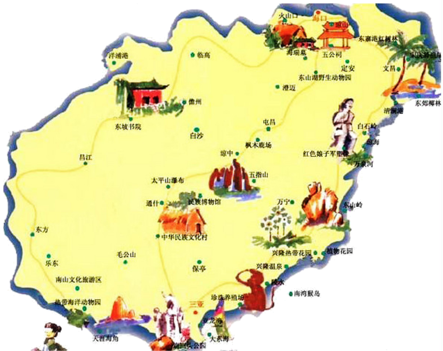
海口景点分布图图