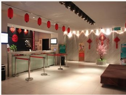
锦江之星 (海口东风桥店)

简介: 锦江之星 (海口东风桥店) 位于海口市美兰区文明东路, 近白龙路口, 周围交通便捷, 距最繁华的海秀东路仅 3 公里。酒店拥有干净整洁的标准房、单人间、商务房共 283 间, 提供 24 小时热水、空调、电视、电话、和免费宽带上网。