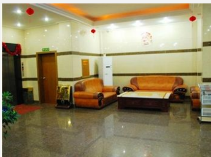
海口南都商务酒店

简介：海口南都商务酒店位于琼州大道，近高速路口、琼北车管所，交通十分方便。酒店设有豪华房、棋牌房、电脑房等房型，房型类型多样内设各种床型，可满足宾客不同居住需求。客房内相应配套设施齐全，舒适的睡床、柔軟的被褥，并有免费无线上网，是宾客理想之选。