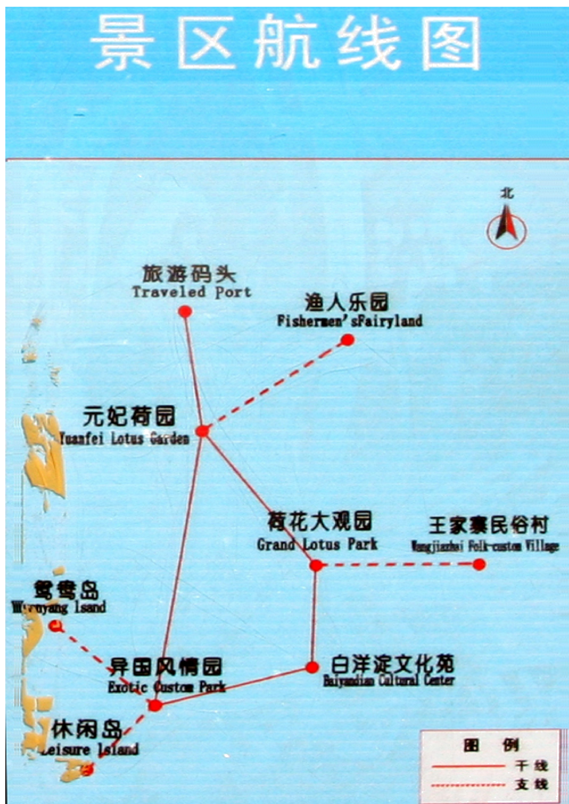
白洋淀景区航线图