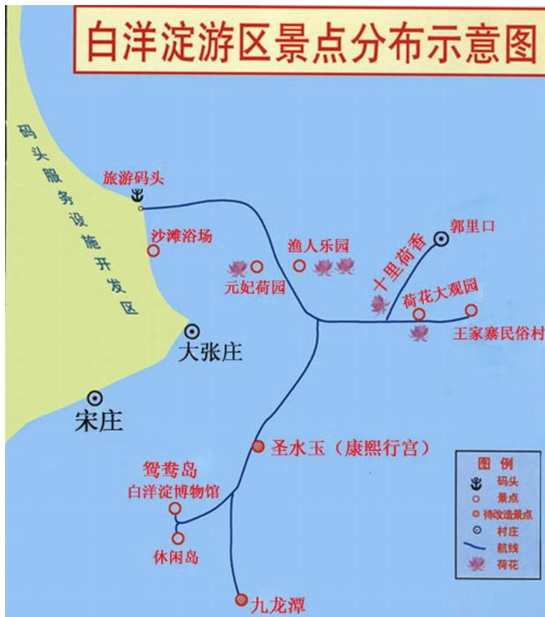
白洋淀景点分布示意图

白洋淀有荷花大观园、文化苑、异国风情园、鸳鸯岛、白洋淀之窗、元妃荷园、王家寨民俗村、渔人乐园、休闲岛等景点，这些都是白洋淀旅游项目的重点，目前都已经相当完善，尤其以前五个人气最旺，最受欢迎。