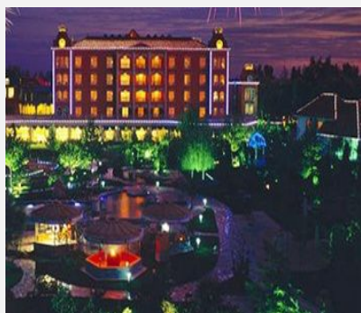
白洋淀凯盛温泉度假村

简介：坐落于安新县旅游路北侧，距离白洋淀码头不足一公里，度假村占地面积 80000 平方米，总建筑面积 20000 平方米；度假村采用欧式园林的建筑风格，2007 年开业，园区生态良好环境景色怡人，附近闹中取静。步行即到明珠游乐园。并且方便前往汽车站，距离安新县繁华的建设大街乘车十分钟即到。