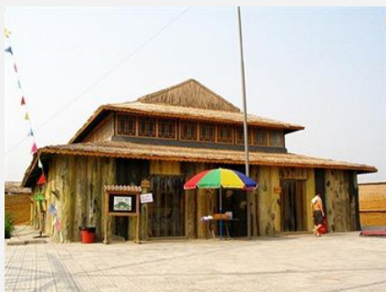
白洋淀十里荷香度假村

简介：位于郭里口村十里荷香景区内，四面环湖，待到荷花开时，湖面泛起微光，闻着荷花香，感受难得的一份宁静。度假村客房总数 70 间，房内基本设施完善，装修温馨。住宿环境十分舒适。是您休闲度假的理想之所。