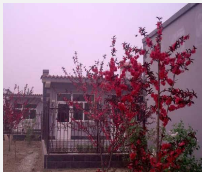
保定安新县莲鱼岛饭店

顾客点评：这个地理位置离白洋淀码头挺近的；出行的话出租车什么的好像不是很方便。总之据说是当地最好的一家酒店，有温泉，还有那个鱼疗，还有蒙古包，只是下雨天比较潮，周边环境好。... 更多