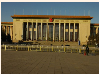
北京精品 2 日游 280 元起 立即预订