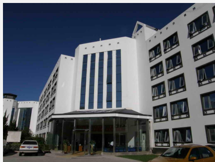
北京邮电会议中心

简介：北京邮电会议中心地处清华、北大及中关村高科技园区；近邻颐和园·圆明园独有的院落式建筑，风景秀丽；汇集全国近千家出版物的“图书城”举步可到。