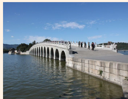
八达岭长城、十三陵陵墓精华 1 日游 100 元起 立即预订