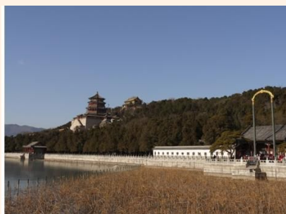
北京故宫一日游|含价值 80 元慈禧水道 238 元起 立即预订