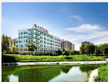
北京世纪华天大酒店

顾客点评：相对于价格而言，房间有点小。服务很周到，还有个大院子，颇有景致，带孩子玩可消磨点时间。设施有些旧。离北大西门走路即可。满意。... 更多