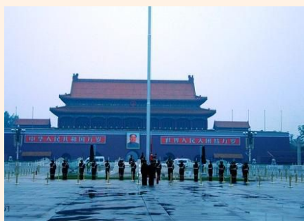
北京奥运一日游 218 元起 立即预订