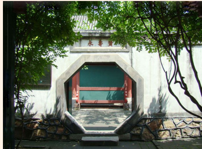
北京纯玩五日游-全程无购物 750 元起 立即预订