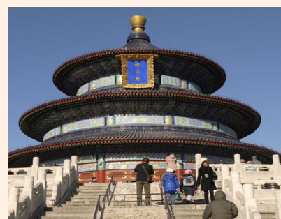
北京纯玩 3 日游_特色景点十大赠送 550 元起 立即预订