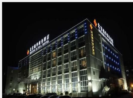
北京锡华商务酒店

顾客点评：好的地方是，酒店比较干净卫生，住宿舒适。价格适中，地理位置偏僻，不好找。... 更多