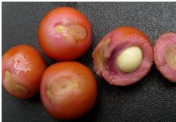
同里特产：芡实（鸡头米）

这是同里土特产的上品，产自同里西北荡的芡实（俗称“鸡头米”）被誉为“水中人参”。据《本草纲目》记载，芡实主治湿痹、腰脊膝痛、补中、除暴疾、益精气强志、令耳目聪明、开胃助气、止渴、益肾、治小便失禁等等。可作药膳之用，以水浸泡半天，用文火煮酥，可配红枣、莲子、桂圆更美味。