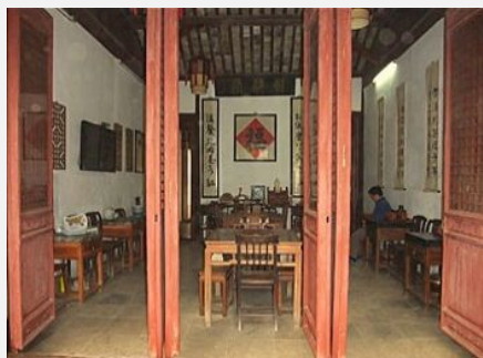
同里敬仪堂民居客栈

简介：同里敬仪堂客栈位于古镇镇中心，地理位置优越，出门即是有名的三桥，去往退思园、珍珠塔、耕乐堂、崇本堂、嘉阴堂等景点十分便利。