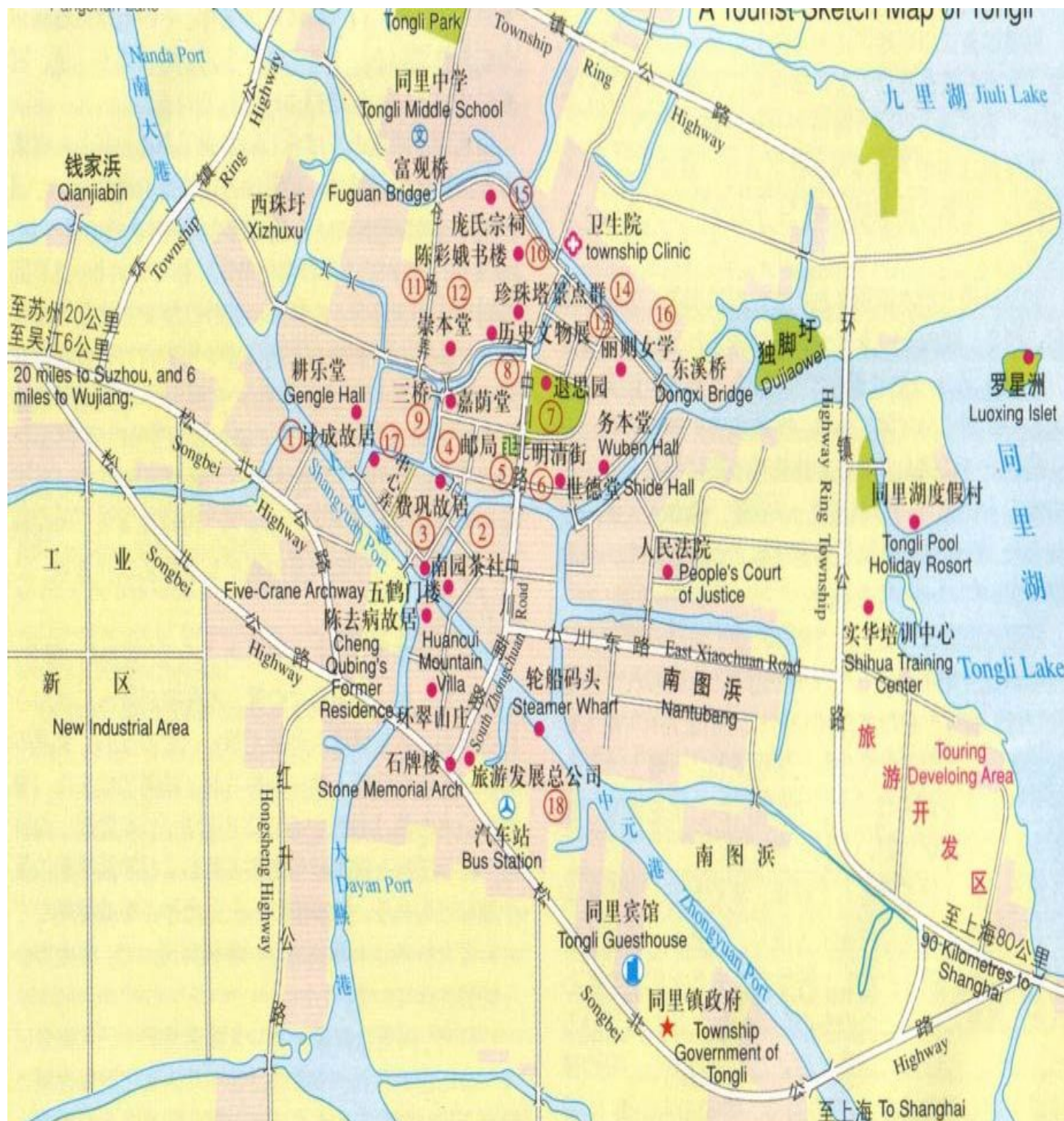
同里旅游景点示意图