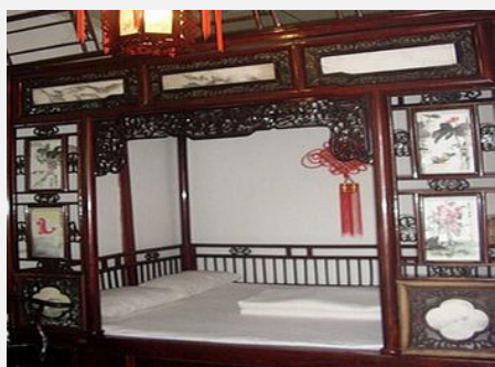
同里金峰民居客栈

简介：客栈拥有各类客房，其中包括富贵牡丹古典套房、花好月圆古典房、九子白兰花房、卷子画花套房、标准间、中国结雕花大床房，一楼配有妖精的酒吧，提供咖啡奶茶鸡尾酒益智桌游等，是宾客旅游、度假的理想居所。