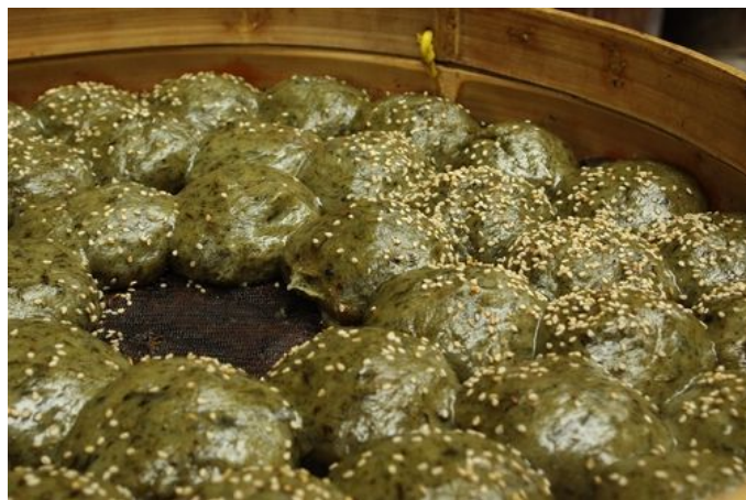
同里美食：麦芽糖饼

蒸熟待饼凉后，在平底锅上油煎，煎至撒芝麻的一面略呈金黄色，用刷子涂上用麦芽做的糖水，这时，清香扑鼻、黛青光亮、细腻甜糯的麦芽塌饼便呈现在面前了。