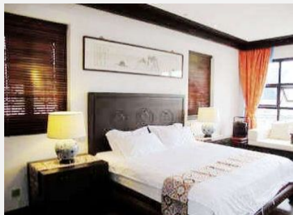
同里正福草堂客栈

简介：草堂源于家宅，辛巳初秋成。飞虹小筑揽二楼于东北，回廊绕于西南，庭院阔数丈。楼间环斗水为池，锦鲤数尾，刨竹三曲引水于其上，霏微如雨露，滴沥飘洒，水声不绝于耳。廊前植松竹梅兰，微风过处，摇曳生姿，自有一番婀娜。草堂所设皆旧日江南人家之物，或素雅，或华美，但求还原水乡之韵味，雅士之风华。