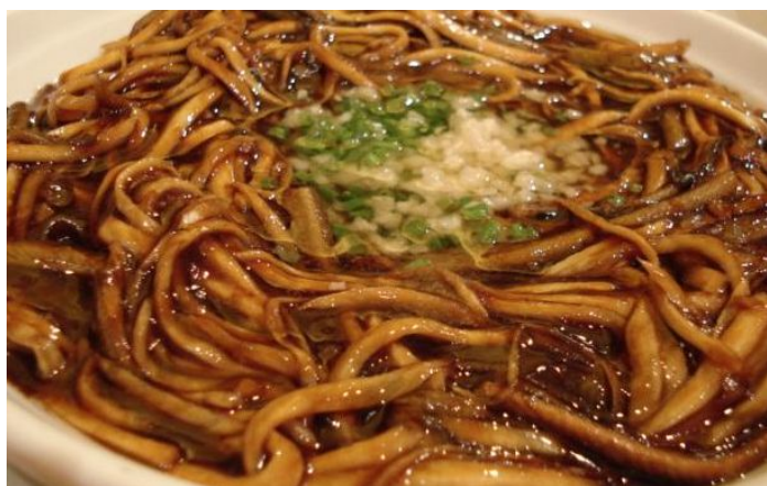
同里美食：响油鳝糊

响油鳝糊是一道上海菜，因为菜装盘后，最后要淋上热油，所以抬上桌那瞬间还会发出“滋滋”的声音。