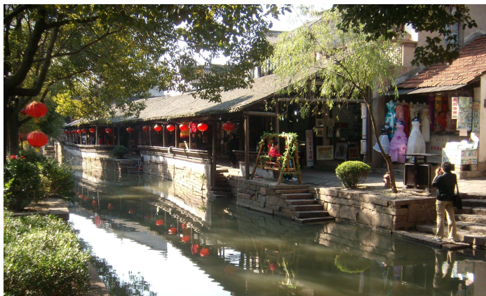
图片来源：欣欣会员— 赏雪饮茶 （甪直古镇）