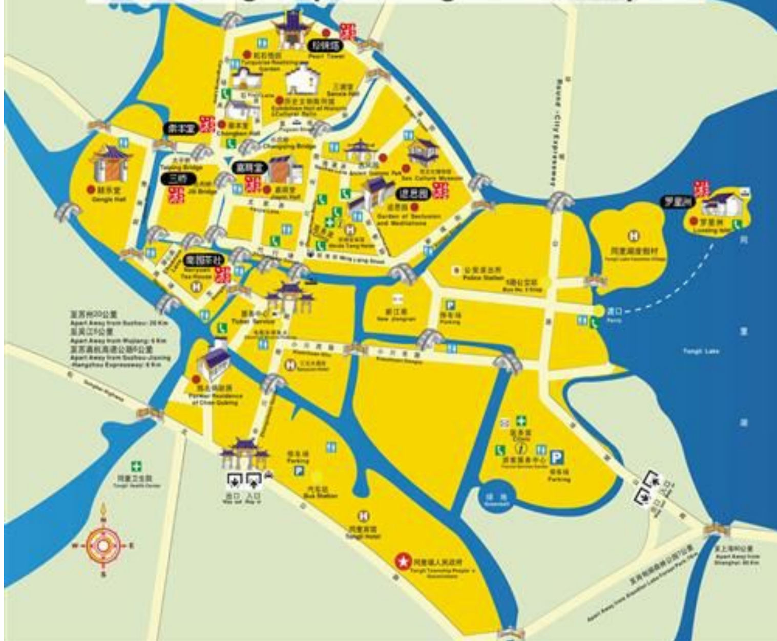
同里风景区游览图