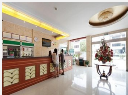
格林豪泰（吴江同里快捷酒店）

简介：格林豪泰（吴江同里快捷酒店）坐落在中国历史文化名镇同里镇环湖西路上，紧邻同里汽车站，依傍风姿绰约的同里湖，位置优越，交通便利，气候宜人，有着“醇正水乡，旧时江南”之称。