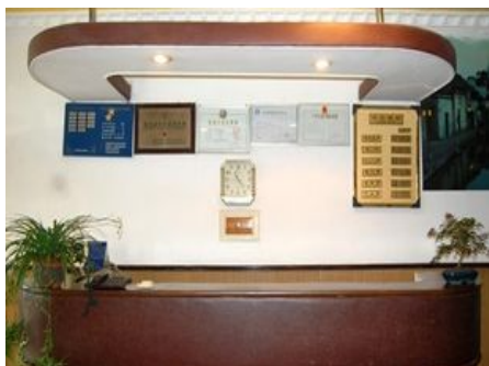
湖州南浔浔房迎宾楼

简介：湖州南浔浔房迎宾楼坐落于南浔旅游名地“百间楼”旁，距 318 国道约 200 米，交通便利。客栈以优质的服务，良好的环境服务大众多年，有各类房间 20 多间，房间有独立卫生间、空调、供应热水洗澡等。客栈地处南浔千年古街东大街与百间楼民俗街中心，旁边有“张氏故居”，九屈桥风景优美小桥流水十分惬意。