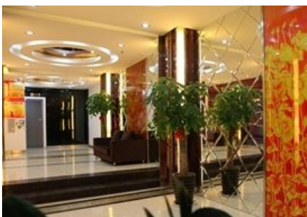
湖州南浔优友万好酒店

简介：湖州南浔优友万好酒店位于南浔区万顺路 31 号，地处风景秀美的南浔古镇，是一家趋于简约风格的快捷型连锁酒店。酒店地处南浔区中心，与泰安车站相邻，离景区仅五分钟车程。优越的地理位置，为来自五湖四海的宾客提供了极大的便捷。