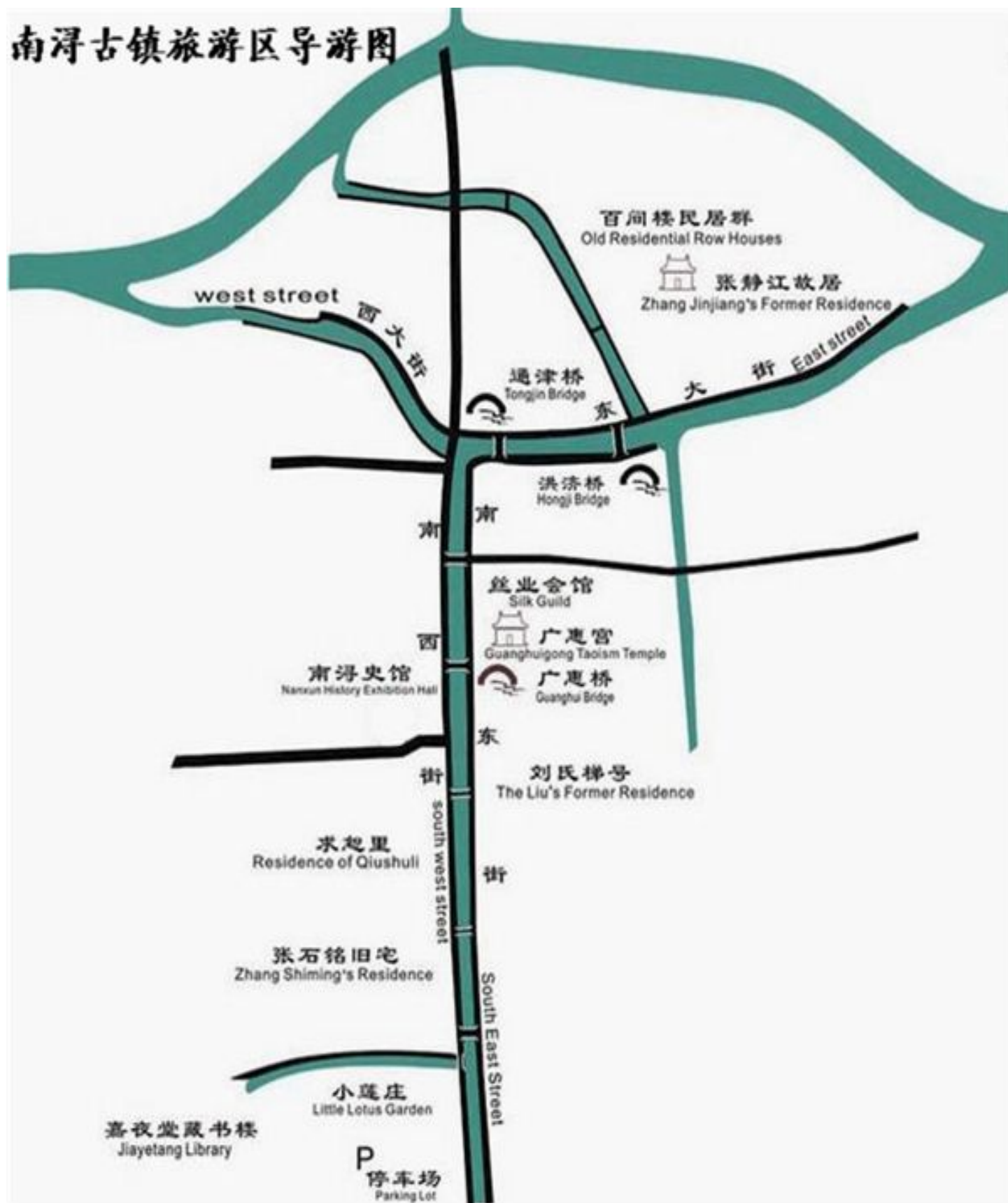
南浔古镇旅游区导游图