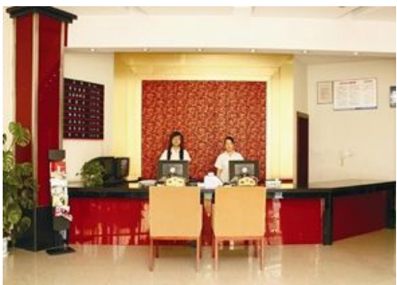
湖州南浔 6.1 风尚酒店

简介：湖州南浔 6.1 风尚酒店地处中国魅力古镇南浔，是一家中式建筑有中国特色的商务型风尚酒店，建筑面积 3500 平方米，传统的建筑外型，豪华精致的装修，完善得到客房配置，闹中取静的优雅的环境，形成了它与众不同。