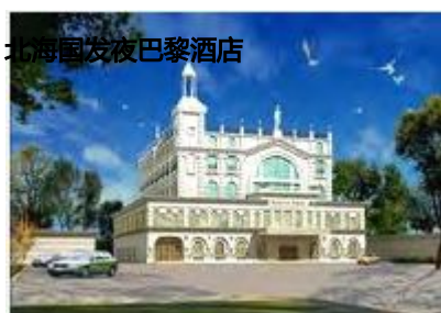
北海国发夜巴黎酒店

简介：酒店位于北部湾中路，背靠北海最大的花卉中心——中山公园，四季鸟语花香、举目皆春，毗邻国通购物中心、解放广场、人民剧场、新华书店。