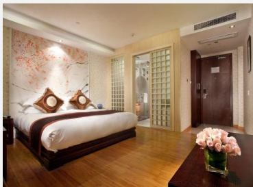
怡莱连锁酒店（寒山寺枫桥店）

顾客点评：苏州格林豪泰酒店（火车站店）交通方便，位于公交（平门）站傍，火车站距公交（平门）站仅一站之距。环境卫生较好，尤其服务态度特好，旅客晒在屋顶的衣物如当日晚未及时返店或遇雨天，服务人员都会为旅客收掇，美中不足的只是我当时所住房间窗户太小，光线较差 ... 更多