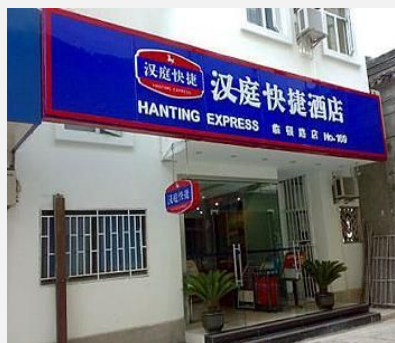
苏州汉庭酒店连锁（拙政园店）

南片以盘门景区为中心。包括苏州大学和著名的美食购物十全街，著名景点有盘门三景、网师园、沧浪亭等。苏州大学本部也位于此处。也很繁华，更添幽远。此处有友谊宾馆、苏州饭店等高档酒店，也有东吴饭店、苏州青年之家旅舍等经济型住宿，标间在 180 元左右。