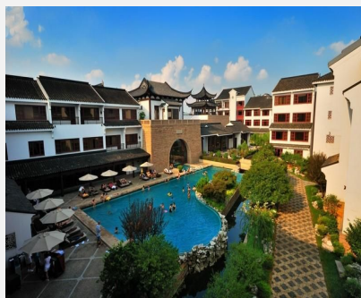
苏州吴官泛太平洋酒店（原苏州吴官喜来登酒店）

简介：苏州吴官泛太平洋酒店座落在苏州市区，位处繁华的闹市区，园林式的设计风格与毗邻酒店的盘门景区相互呼应，住店客人可直接通过酒店花园进入景区免费游览。