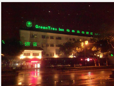
苏州格林豪泰酒店（火车站店）

此外，苏州市区的住宿区还有苏州新区、工业园区、火车站地区和中央公园，这些地方酒店也能让游客随处找到合适的住处。这里特别要推荐在火车站附近的桃花坞国际青年旅舍，最令人惊艳的一幕则是发生在夜晚的露台，灯火辉煌的北寺塔近在咫尺，搬个小马扎坐着，就能与整个苏州城相对着发呆。