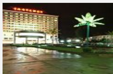
青海省军区招待所（西宁）

顾客点评：还不错，比想象中的要好的多。地处市中心，闹市区。购物交通都很方便，也比较干净卫生。不过入口在背后，比较难找。... 更多