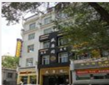
如家快捷酒店（西宁南大街十一中学店）

鸟岛镇上的鸟岛宾馆是当地最高等级的旅馆，是青海湖地区建立较早的、设施较完善的住宿地，房价从38元到288元不等，带浴室的双人房约200-300元左右。每年春秋两季的长假期间，这里会人满为患。鸟岛镇上还有其他一些条件稍差的旅馆，价格从几十元至一百多。